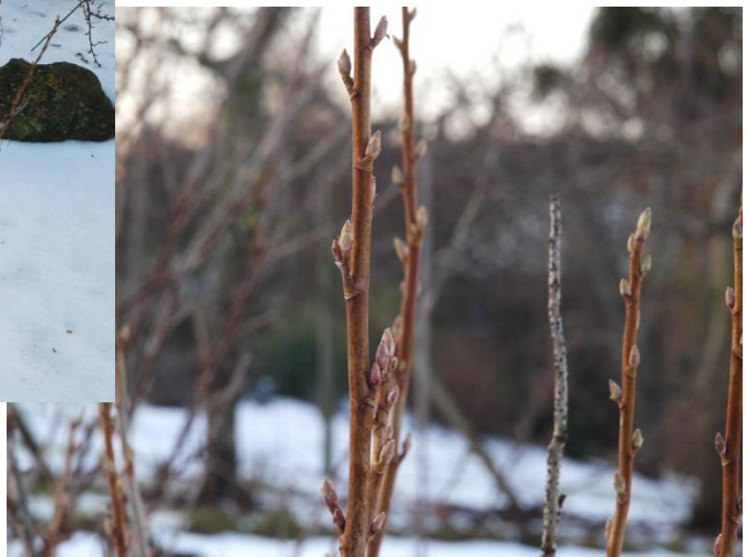
Disse knopper er sunde