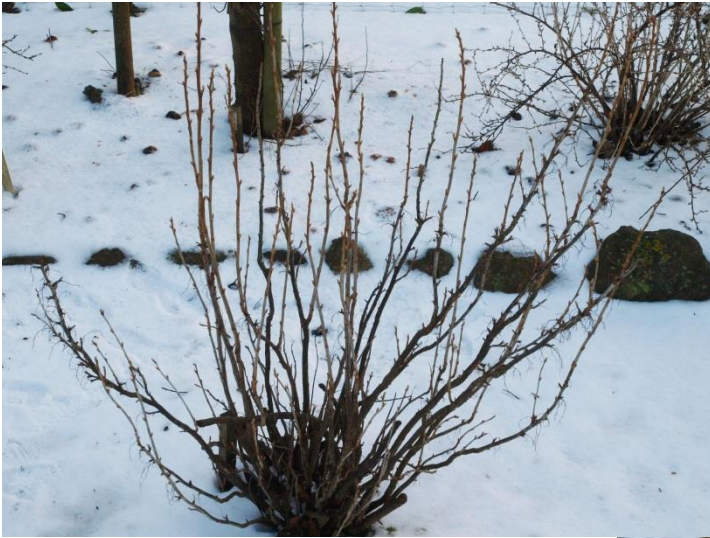
Check dine solbær for knogalmider

Netop på disse korte vandringer igennem køkkenhaven, kan man jo ligeså godt gøre sig lidt nyttig. Der er nemlig nogle skadedyr vi på dette tidlige tidspunkt, kan hindre i at formere sig og gøre skade.